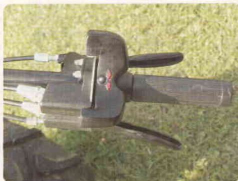
A lato, il braccialetto che permette di invertire la direzione di marcia della motofalciatrice "630 Ws Easy Drive". Il suo azionamento è attuabile con un solo dito, fermo restando che il comando è protetto da un sistema meccanico che impedisce blocchi eventuali involontari da parte dell'operatore