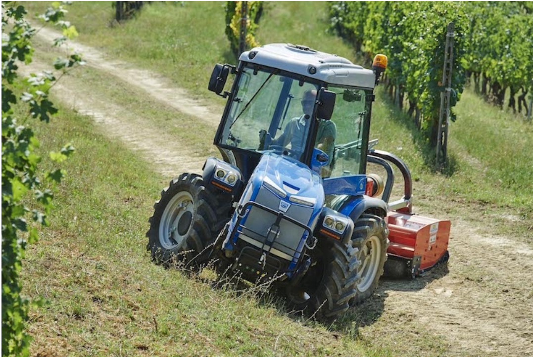
Nuovo Volcan L80 di BCS

Contenuti tecnici innovativi, design elegante e dimensioni compatte rendono i nuovi trattori specializzati in versione Dualsteer® macchine indispensabili per l'agricoltura di domani